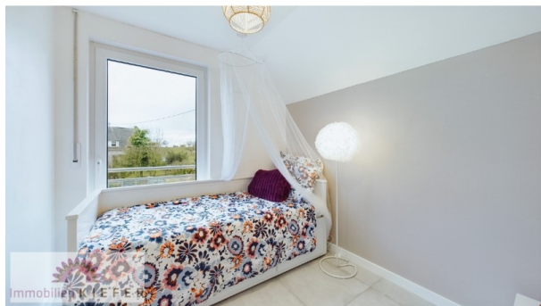
Büro / Schlafen